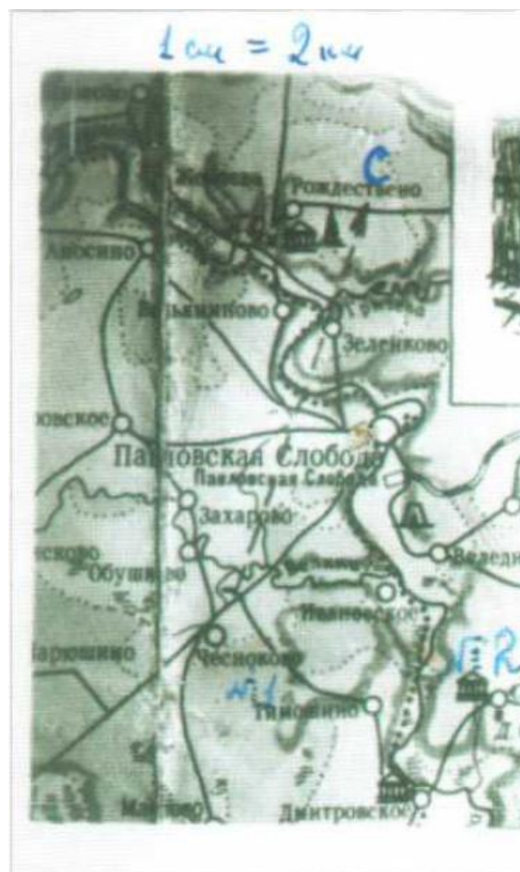
Пояснения к карте Первенства ИАЭ 4 октября 1959 года.

Итак, согласно этому «Положению» в соревнованиях по ориентированию на слете участвовали команды из двух человек (любого пола или смешанные). Получив на старте карту, команда должна была пройти в указанном порядке два контрольных пункта и финишировать на поляне слета. Контрольный пункт представлял собой палатку, в ней находился судья, который записывал в протоколе номера проходящих команд. Длина дистанции была 3 с чем-то километра, хотели меньше, но не получилось. Контрольных пунктов было всего два, часть команд шла в одном направлении, часть в противоположном – по очереди на старте. Участвовало более десятка команд. Определенного стартового интервала не было, просто фиксировалось время